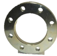
EN-DIN PN 6